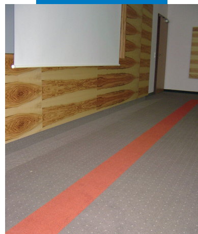
Esempio di utilizzo di Primer G prima della stesura di Ultraplano Eco e dell'adesivo Rollcoll per l'incollaggio della moquette nelle stanze dell'albergo - Villa Hotel Castellani - Austria