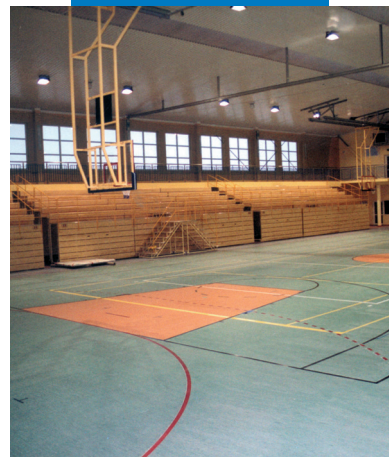
Esempio di utilizzo di Primer G prima della posa di PVC e linoleum in una palestra pubblica - Palestra indoor Gdansk Orunia - Polonia

Le referenze relative a questo prodotto sono disponibili su richiesta e sul sito Mapei www.mapei.it e www.mapei.com