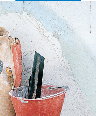
Uso come Primer per intonaci in gesso