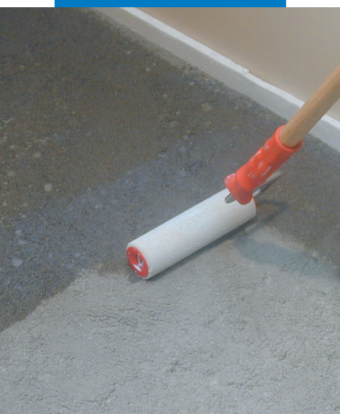
Applicazione di Primer G con rullo